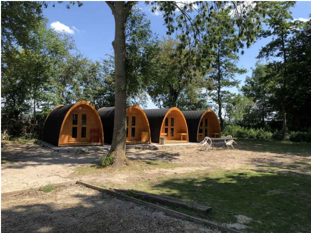
De trekkershutten DKR