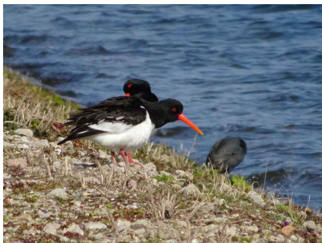
Scholeksters aan land