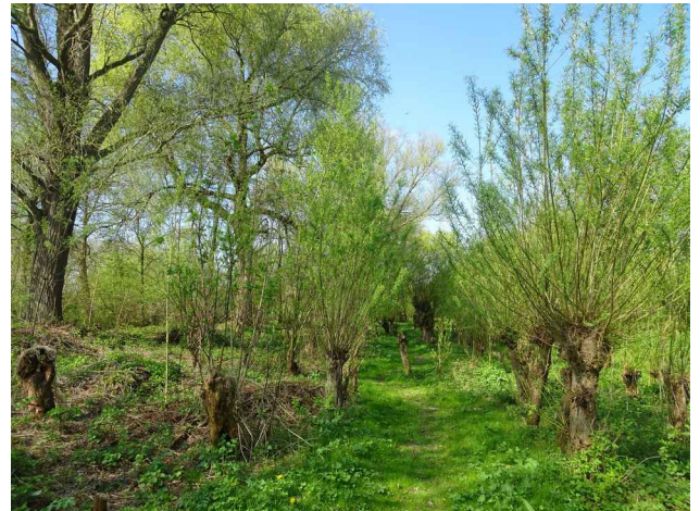
Lente in de griend