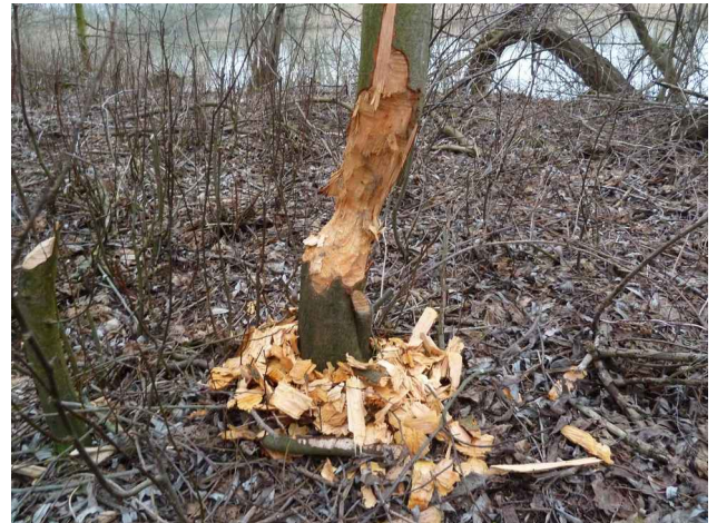
De bever actief