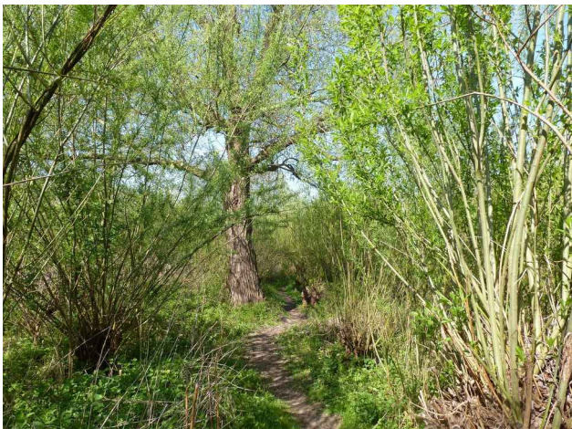
En weer de griend