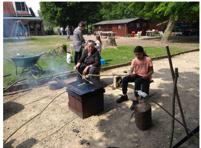
Brood bakken met kinderen