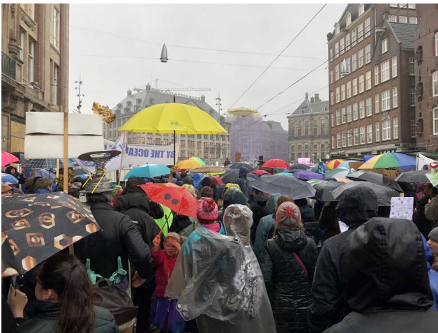
Klimaatmars Amsterdam 10 maart 2019