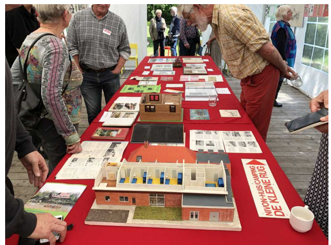
Expositie 50 jaar Kleine Rug