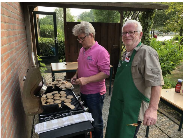
Een paar "Bakburgers"