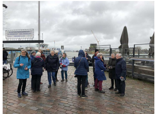
Nivon Cultuurgroep op stap