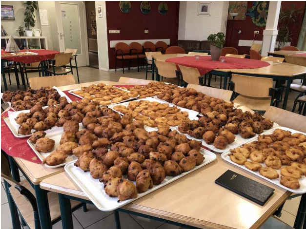
Bakwerk nieuwjaar DKR + Afdeling