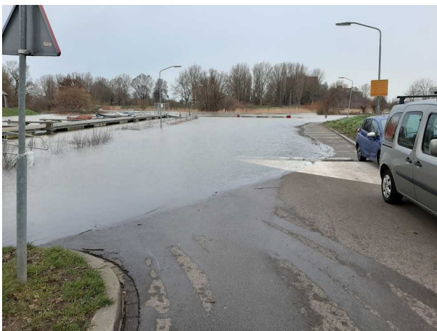
Hoog water aan de Loswalweg