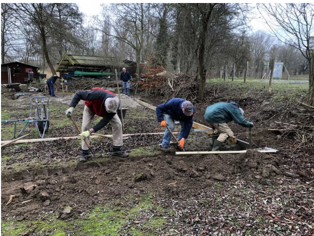
Fundering trekkershutten in de klei