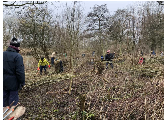
Griendwerk: kappen, zagen en sjouwen