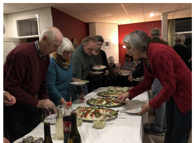
Doe mij die salade ook maar