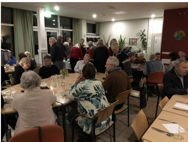
Volle bak bij mosselmaaltijd