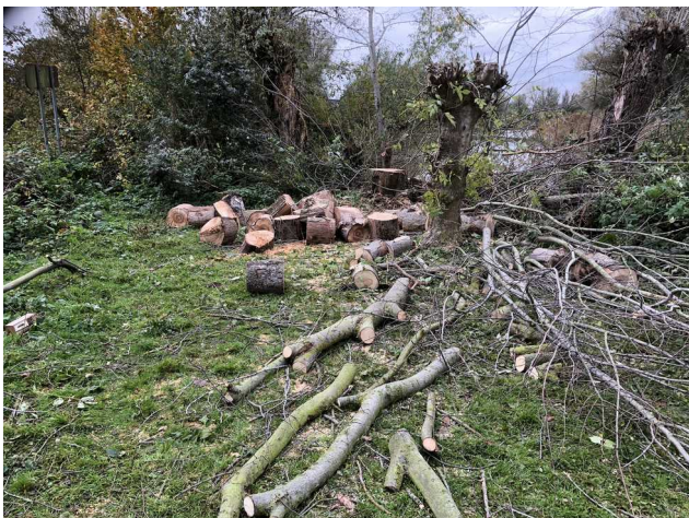
Houtkap dode boom