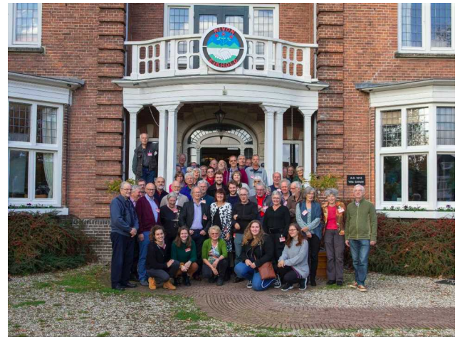
Nivonraad november 2019, Eikhold