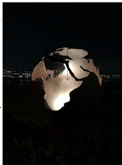
Bezoek Tij festival 17-11-2022

De organisatoren zijn benieuwd wat jullie tot nu van de activiteiten vonden. Sluiten ze een beetje aan bij jullie belangstelling? Zijn de tijdstippen handig? Laat het even weten.